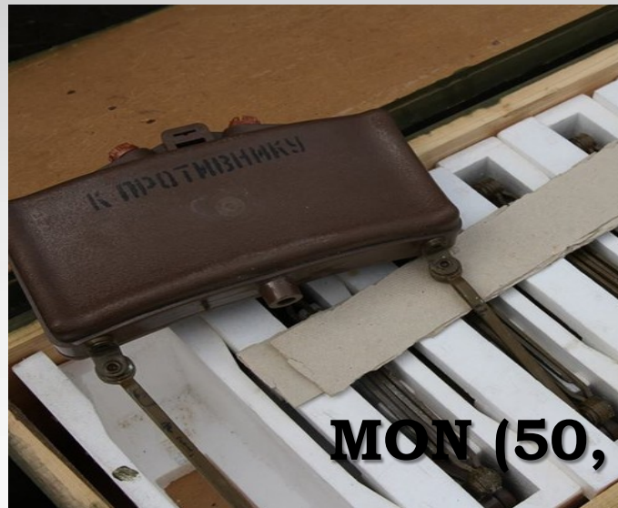
MON (50, 90, 100, 200) Directional anti personnel mine